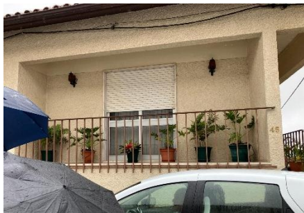
(1:00) Percurso 5 – com gaiteros