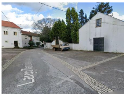
(2:15) Percurso 10 – com gaiteiros