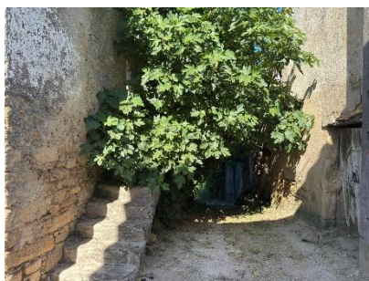
(1:20) Percurso 7 – com gaiteros