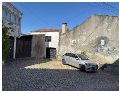
(0:15) Percurso 8 – com gaiteiros