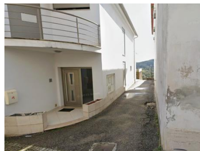
(1:20) Percurso 9 – com gaiteiros