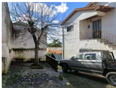
(0:50) Percurso 6 – com gaiteros