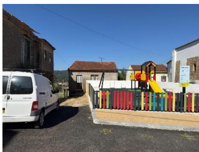
(0:50) Percurso 8 – com gaiteros